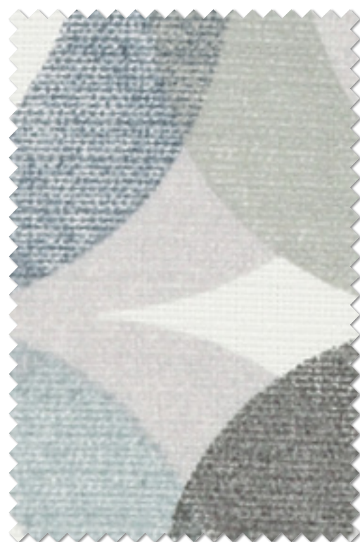
FT 6294 (GR)