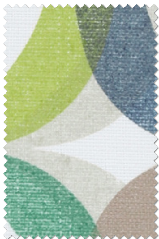
FT 6293( G )