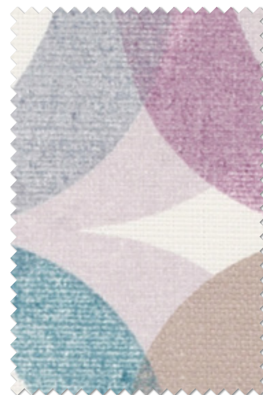
FT 6295 (LV)