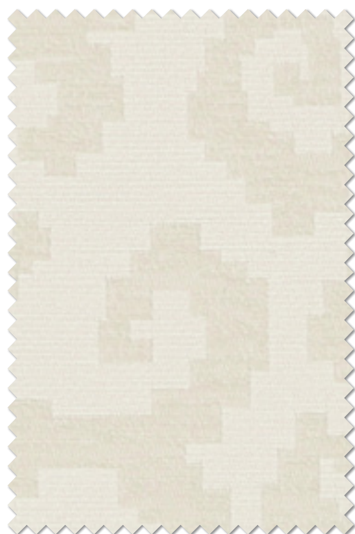
FT 6284( I )