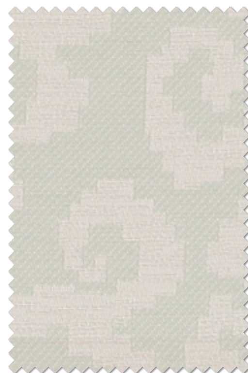
FT 6286( LP )