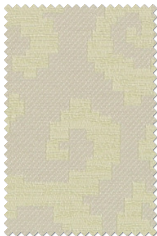
FT 6285( LY )