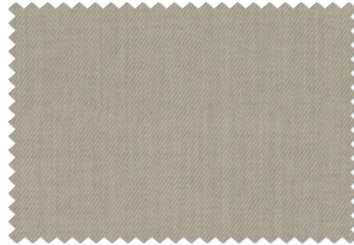
FT 6281 (LGR)