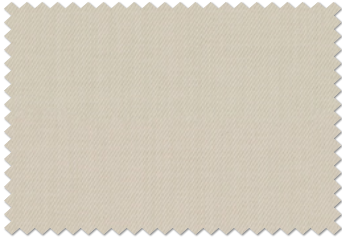
FT 6280( I )