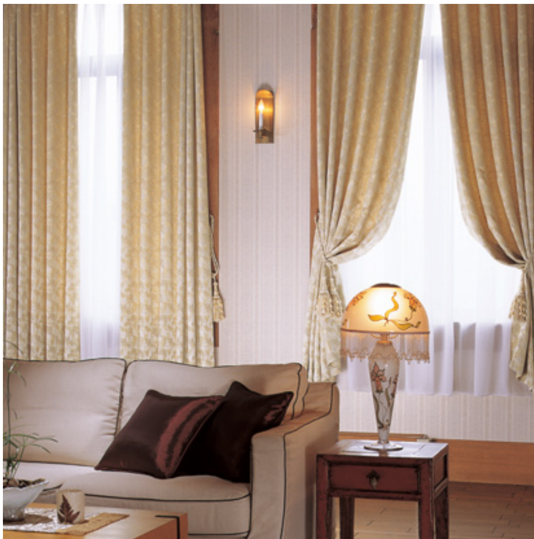
ドレープ | FT6256 (ファインウェーブ) / レース | FT6693 (スタンダード) / タッセル | 非売品 / クッション | 非売品