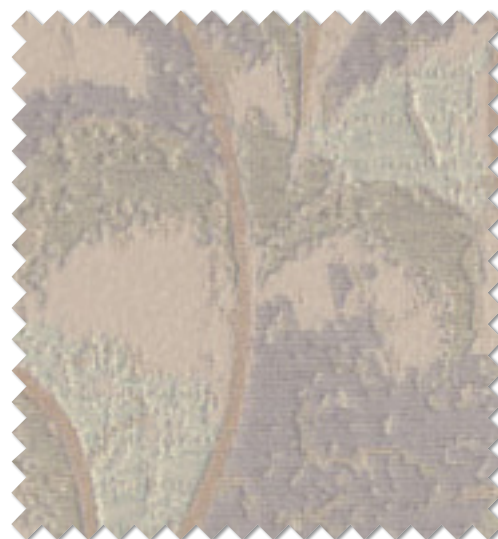
FT 6257 (V)