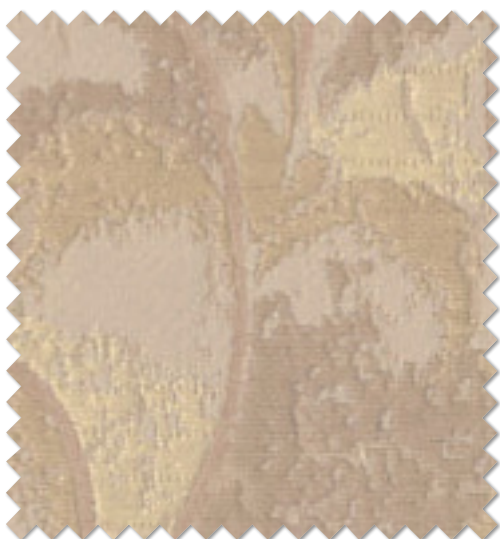
FT 6256 (BE)

※( )部分について…製作幅30cm～39cm迄の場合、丈201cm以上は製作できません。