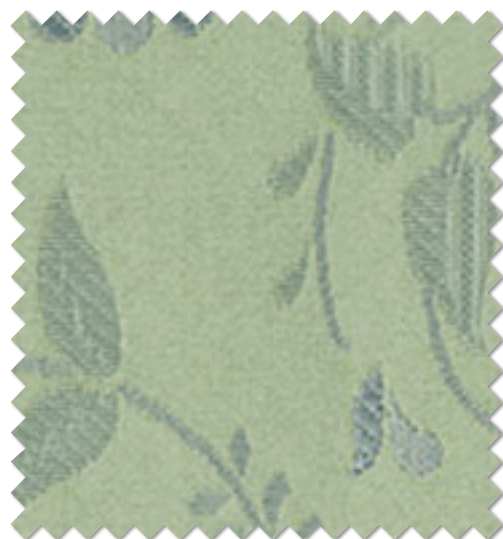
FT 6253 (BG)