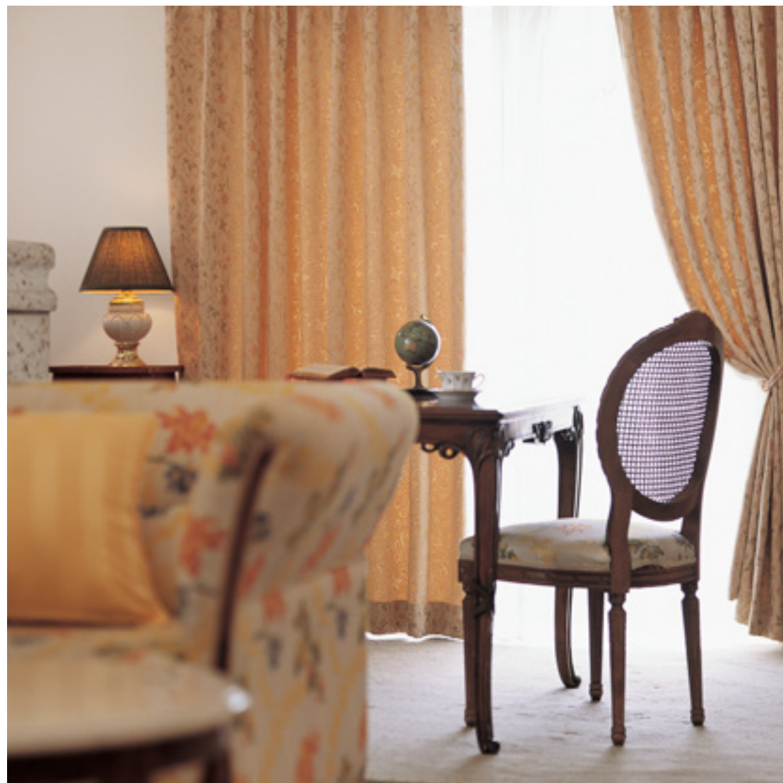
ドレープ | FT6252 (ソフトウェーブ) / レース | FT6701 (スタンダード) / タッセル | 非売品