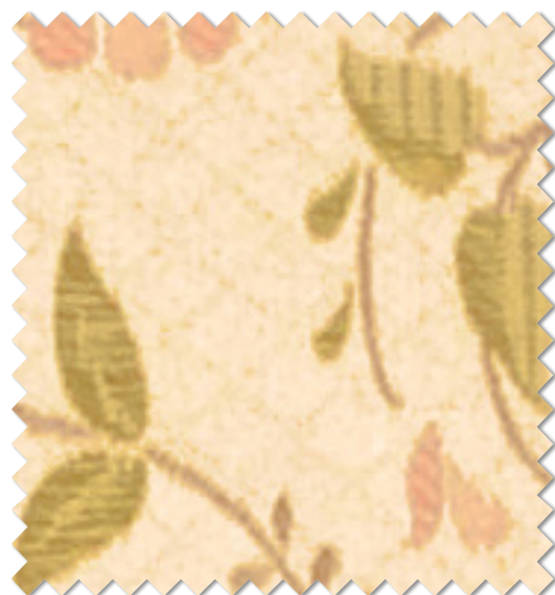
FT 6252 (LO)

※( )部分について…製作幅30cm~39cm迄の場合、丈201cm以上は製作できません。