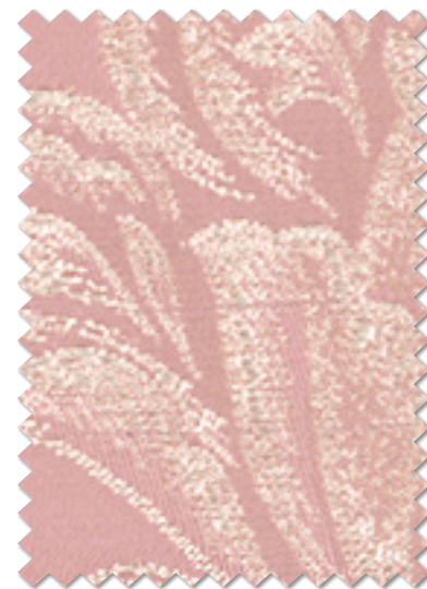
FT 6244 (RO)