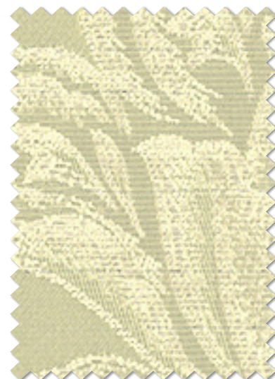
FT 6245 ( G )