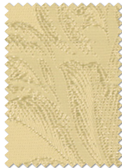
FT 6243 (BE)