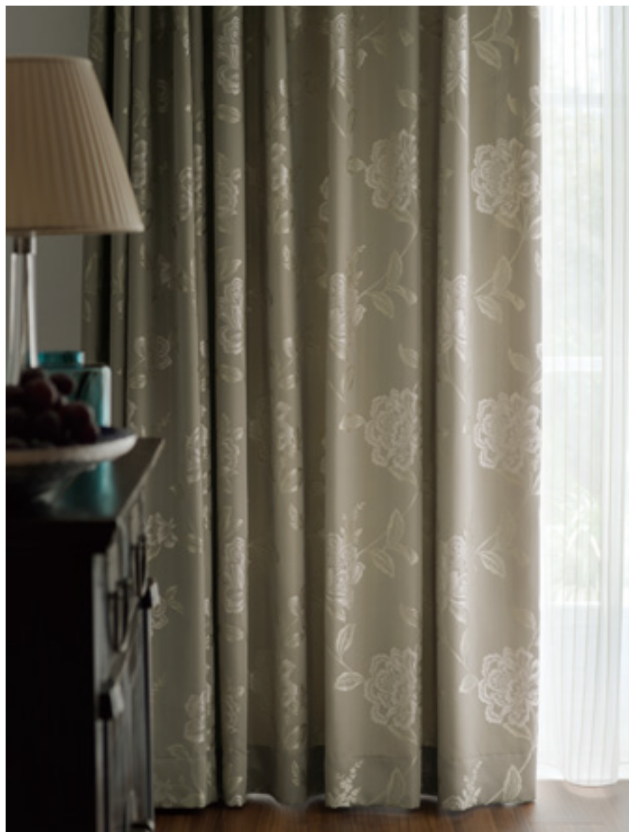
ドレープ | FT6246 (スタンダード) / レース | FT6683 (スタンダード)