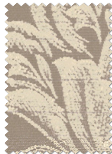
FT 6246 (GR)