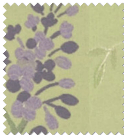
FT 6242 ( G )