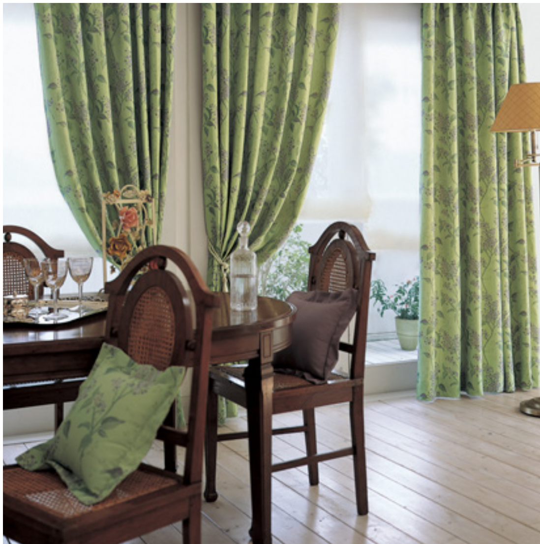
ドレープ | FT6242 (ソフトウェーブ) / ローマンシェード | FT6698 (プレーン) / タッセル | 非売品 / クッション | FT6242 FT6398 (額縁)