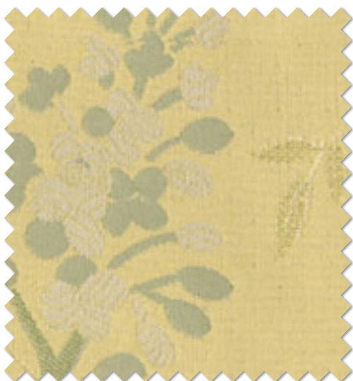
FT 6241 ( Y )

※( )部分について…製作幅30cm～39cm迄の場合、丈201cm以上は製作できません。