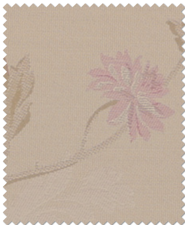
FT 6237( P )