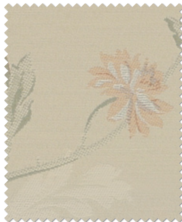
FT 6238( O )