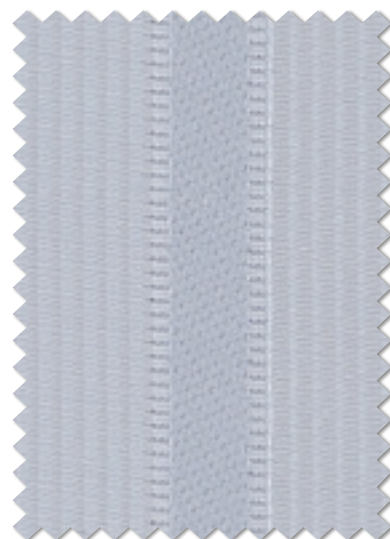
FT 6233 (LB)