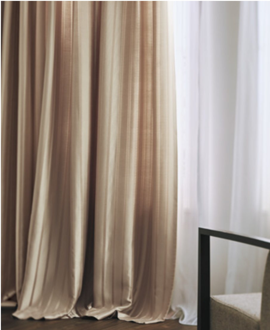
ドレープ | FT6231 (スタンダード) / レース | FT6685 (スタンダード)