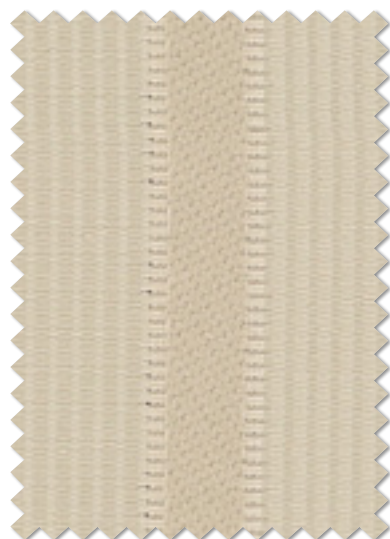
FT 6231 (BE)

※( )部分について・製作幅30cm～39cm迄の場合、丈201cm以上は製作できません。