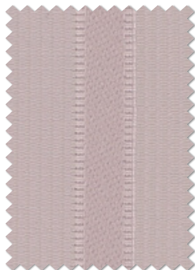
FT 6232 (LP)