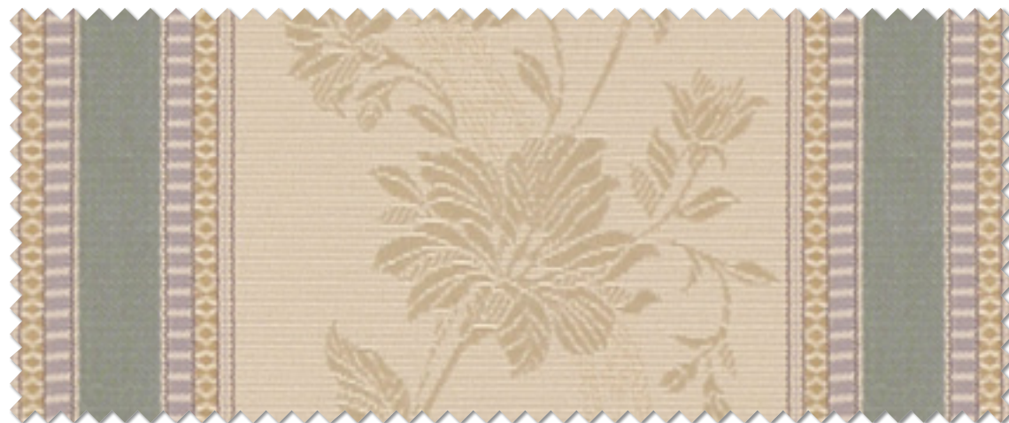
FT 6213( G )