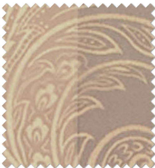
FT 6209 (BE)

※( )部分について…製作幅30cm～39cm迄の場合、丈201cm以上は製作できません。