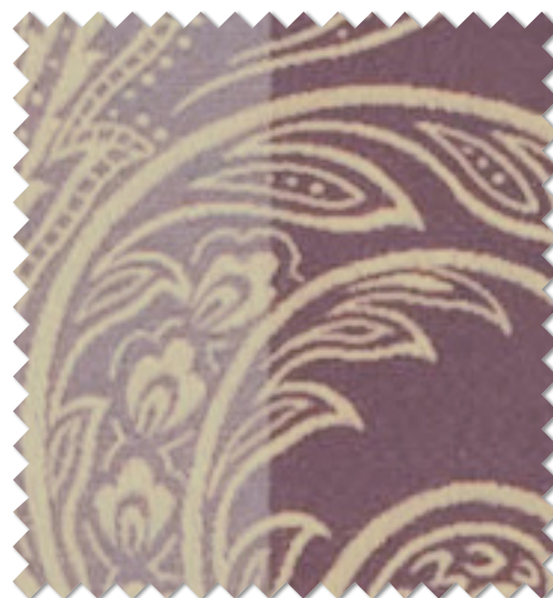
FT 6210 (V)