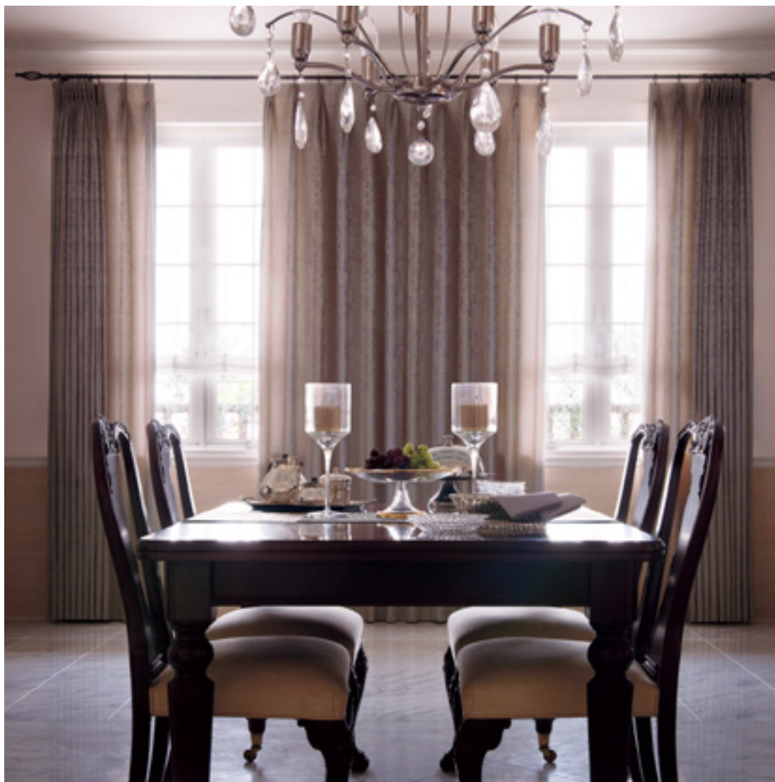
ドレープ | FT6209 (ソフトウェーブ) / ローマンシェード | FT6697 (プレーン)