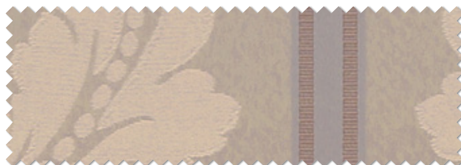
FT 6205( P )