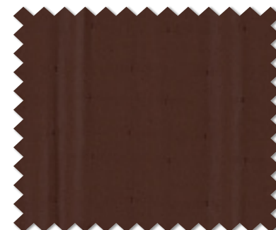
FT 6198 (DR)