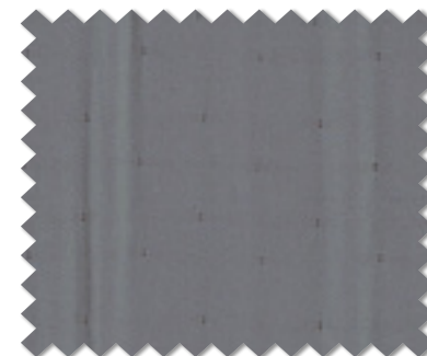
FT 6196 ( B )