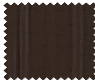
FT 6199 (DB)