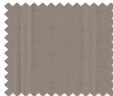
FT 6195 (GR)