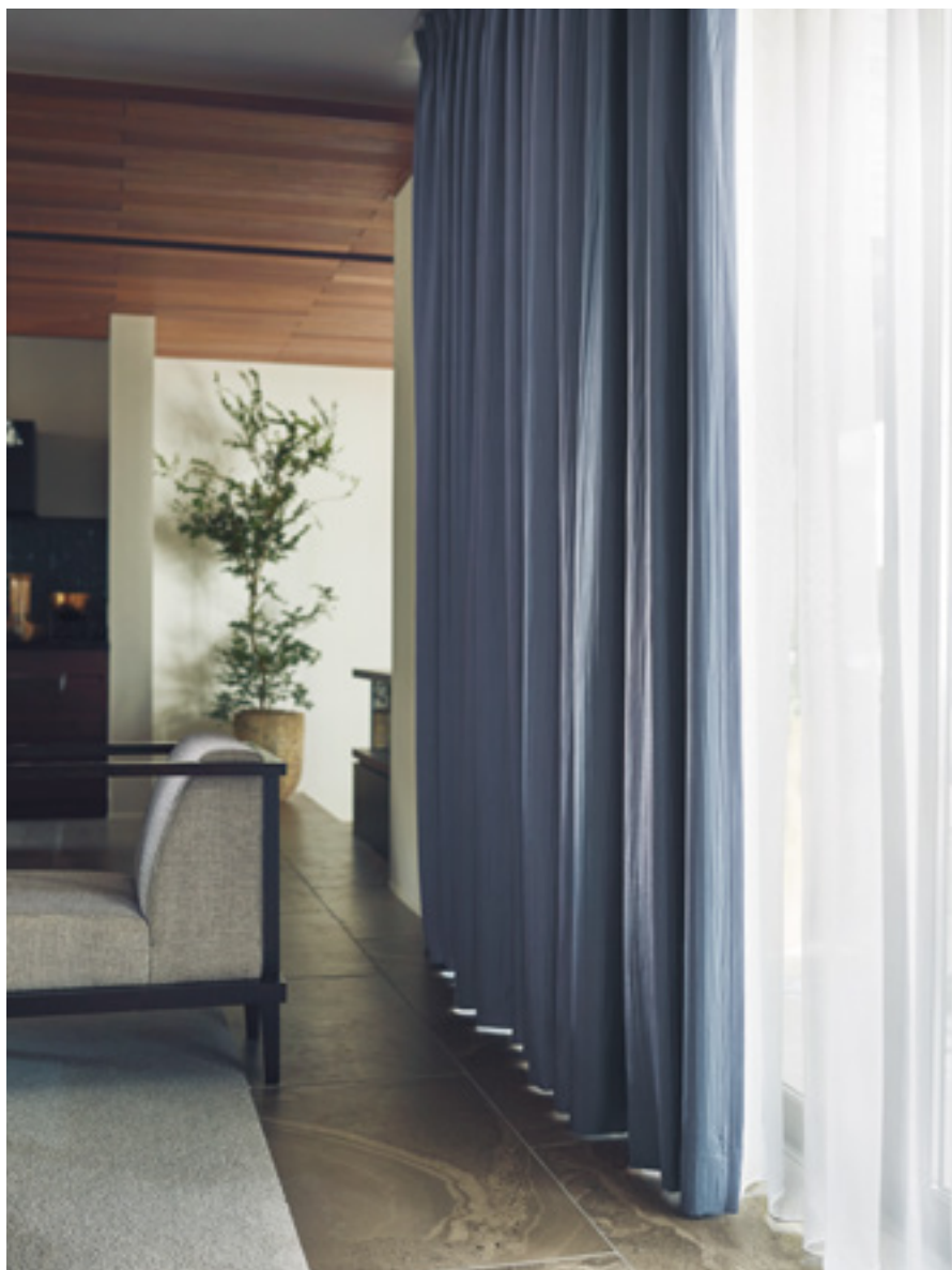
ドレープ | FT6196 (スタンダード) / レース | FT6641 (スタンダード)