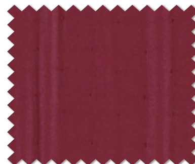
FT 6197 ( R )