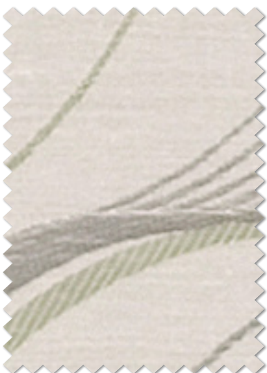
FT 6190 ( I )

※( )部分について…製作幅30cm~39cm迄の場合、丈201cm以上は製作できません。