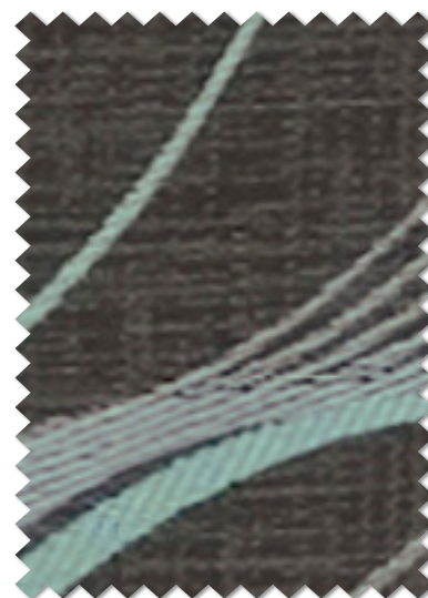
FT 6192 ( DGR )