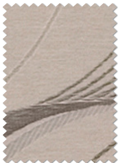
FT 6191 ( BE )