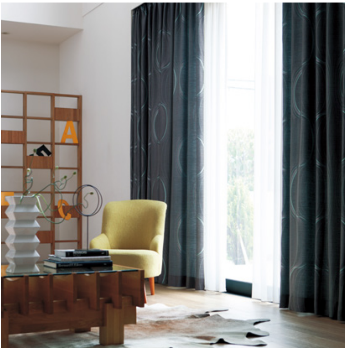
ドレープ | FT6192 (ソフトウェーブ) / レース | FT6699 (スタンダード)