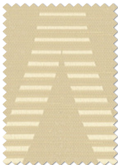
FT 6187( I )