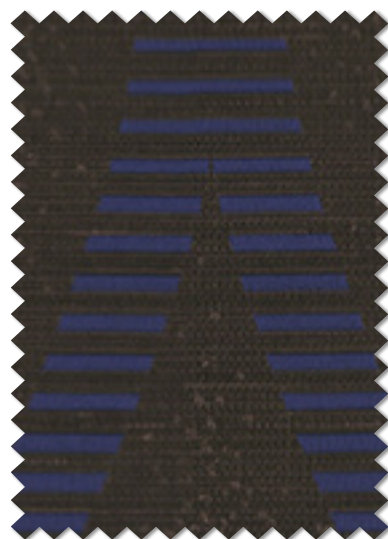
FT 6189( B )