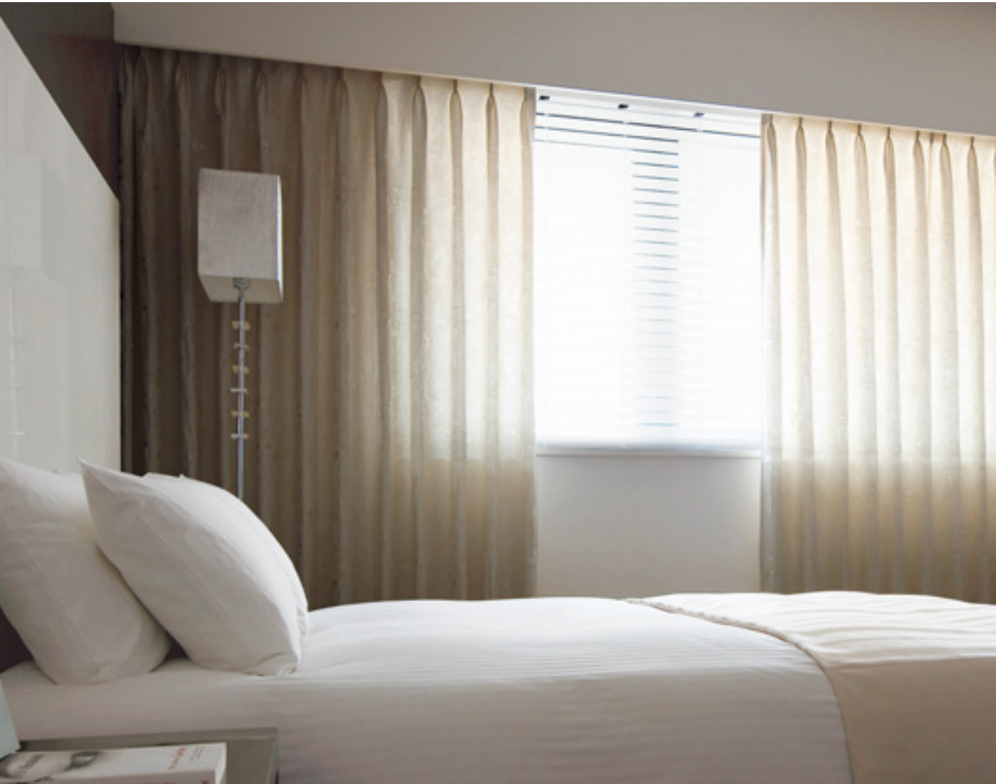
ドレープ | FT6178(ソフトウェーブ)