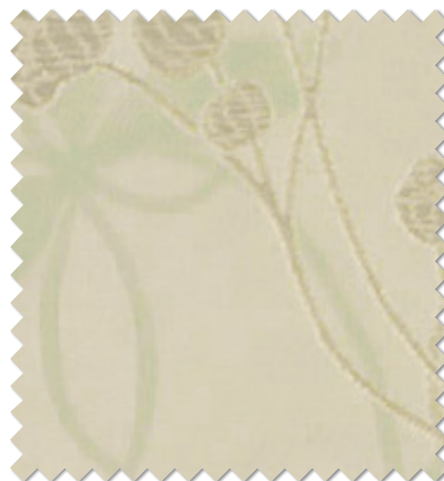
FT 6179( G )