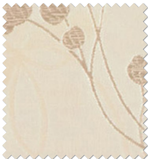
FT 6178( I )

※( )部分について…製作幅30cm～39cm迄の場合、丈201cm以上は製作できません。