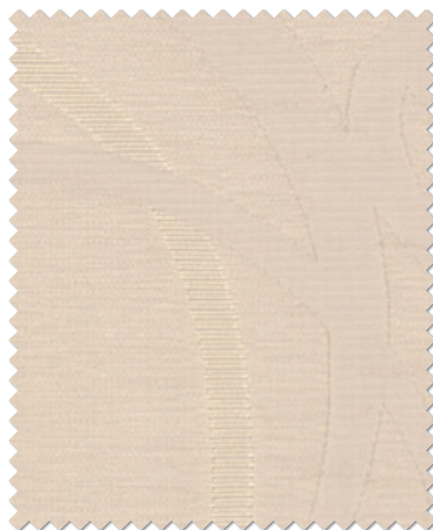
FT 6175( BE )