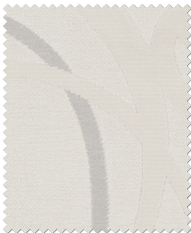
FT 6174( I )