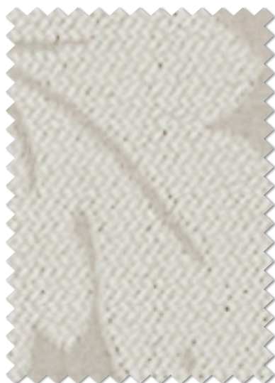
FT 6168( I )

※( )部分について…製作幅30cm～39cm迄の場合、丈201cm以上は製作できません。