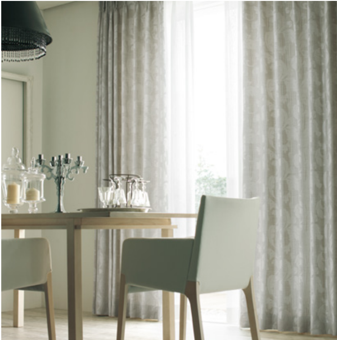
ドレープ | FT6168 (ソフトウェーブ) / レース | FT6655 (スタンダード)