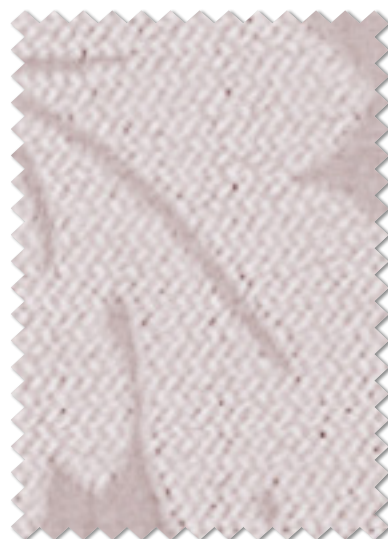
FT 6169( P )