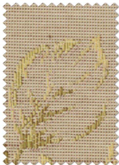
FT 6165( Y )

※( )部分について…製作幅30cm~39cm迄の場合、丈201cm以上は製作できません。