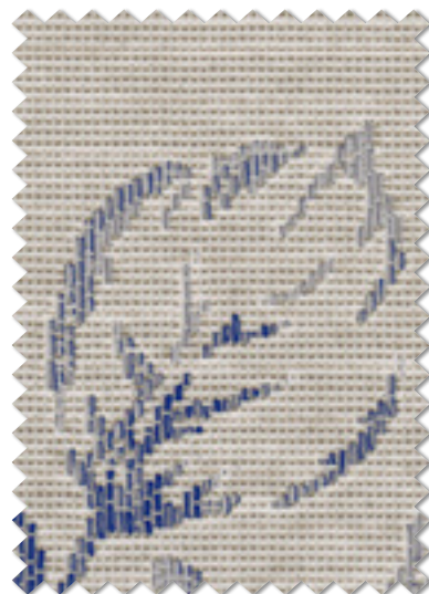
FT 6167( B )