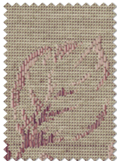
FT 6166( P )