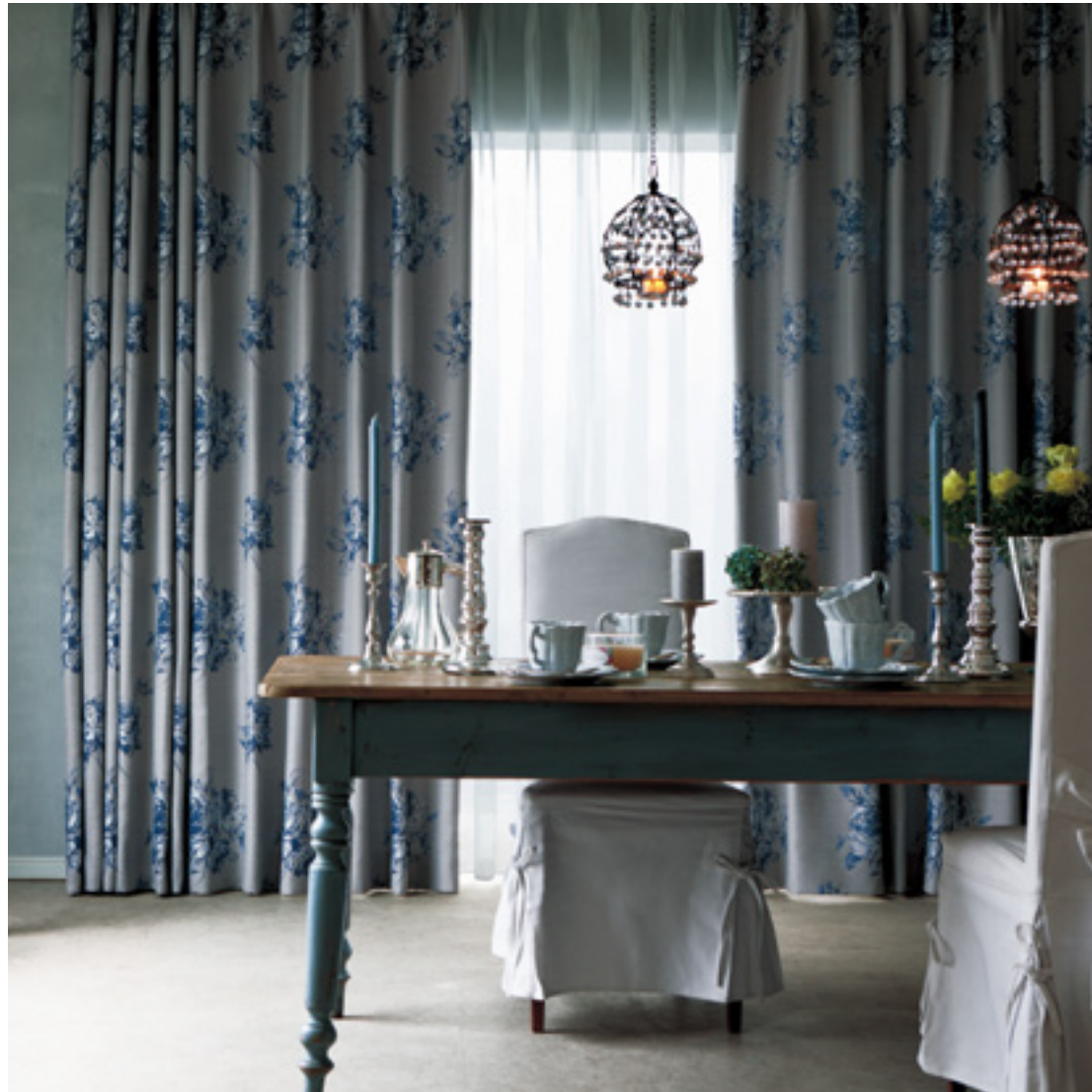
ドレープ | FT6167 (ファインウェーブ) / レース | FT6701 (スタンダード)