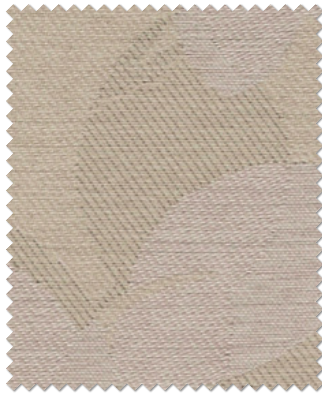
FT 6154( P )