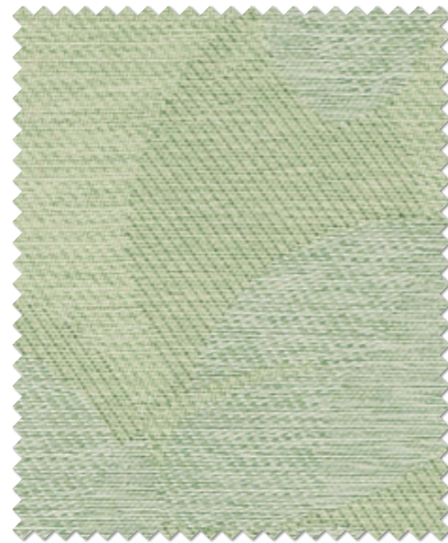
FT 6155( G )