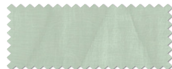
FT 6148 ( BG )