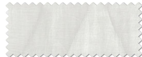
FT 6147 ( W )