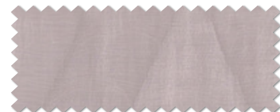
FT 6150 ( V )

ドレープ | FT6150 (スタンダード) / レース | 非売品 (スタンダード) / クッション | FT6143 FT6357 FT6329 (プレーン)