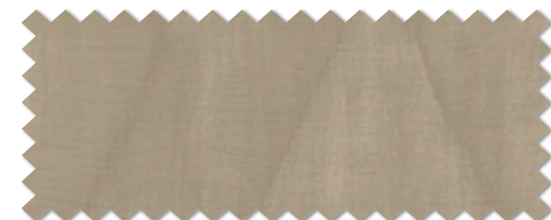
FT 6149 ( BR )