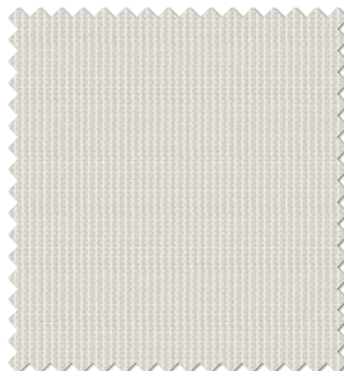
FT 6133(BE) オフシェイド クラス4