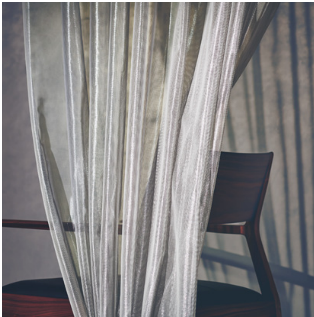
レース | FT6132 (生地)