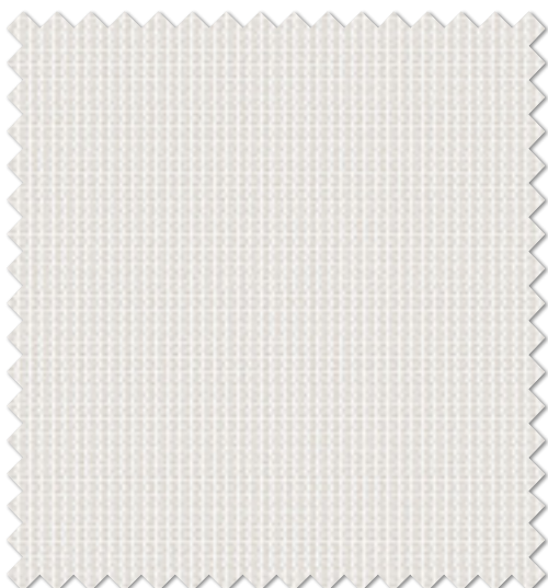
FT 6132(LBE) オフシェイド クラス4

※( )部分について・製作幅30cm～39cm迄の場合、丈201cm以上は製作できません。