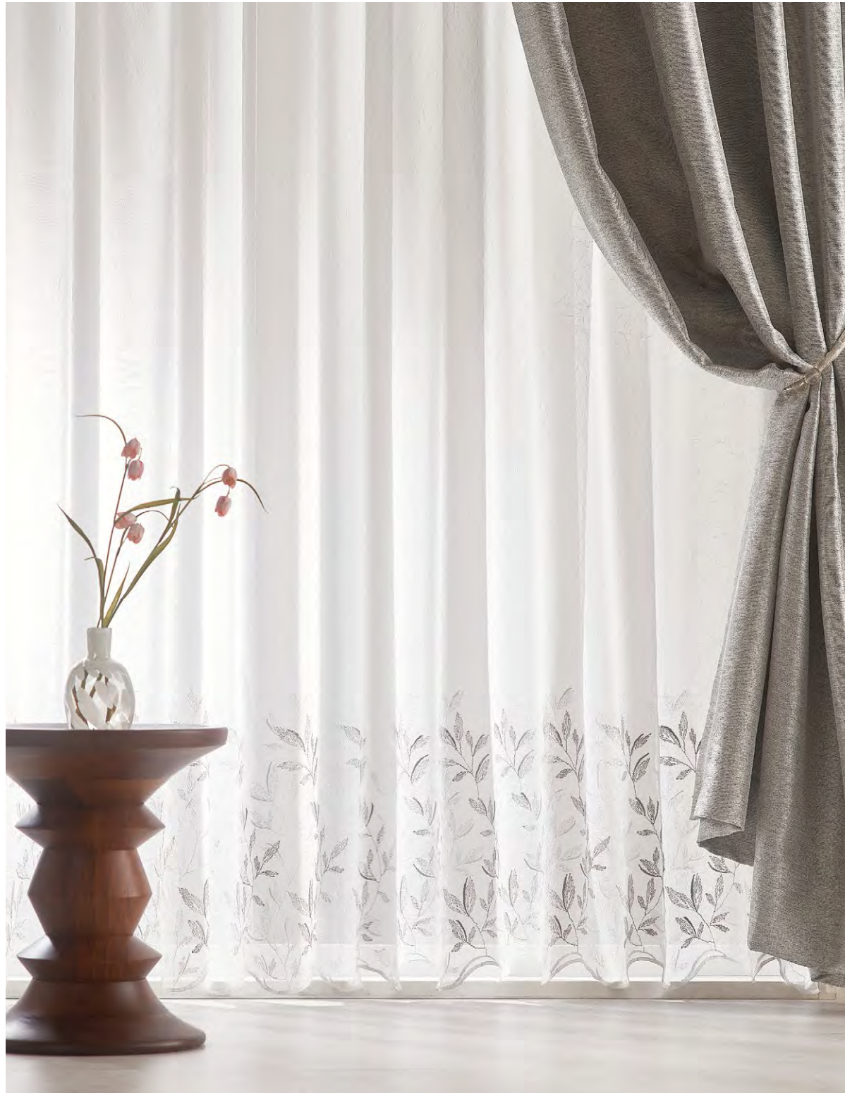
◎シアー/C2179 ●ドレープ/C2108 ◎タッセル/AR3061-05

2色の光沢糸で、リーフ柄の刺繍をほどこしました。 ナチュラルにもエレガントにも美しく調和します。