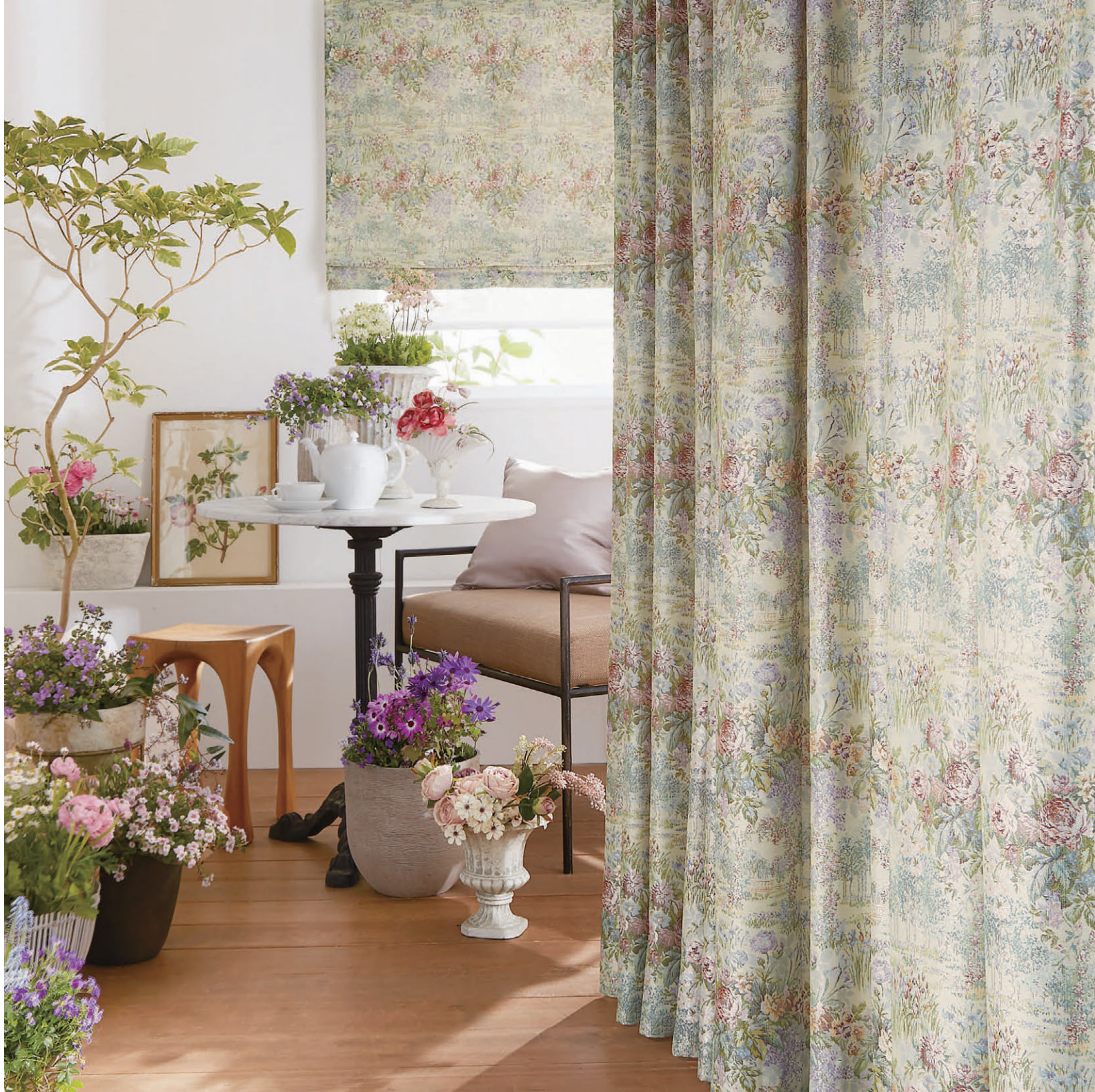
●ドレープ/F1502 ◎シアア/F1506 ◎シェード(WS-11)/部屋側F1502、窓側F1506 ◎クッション(パイピング)/C1224