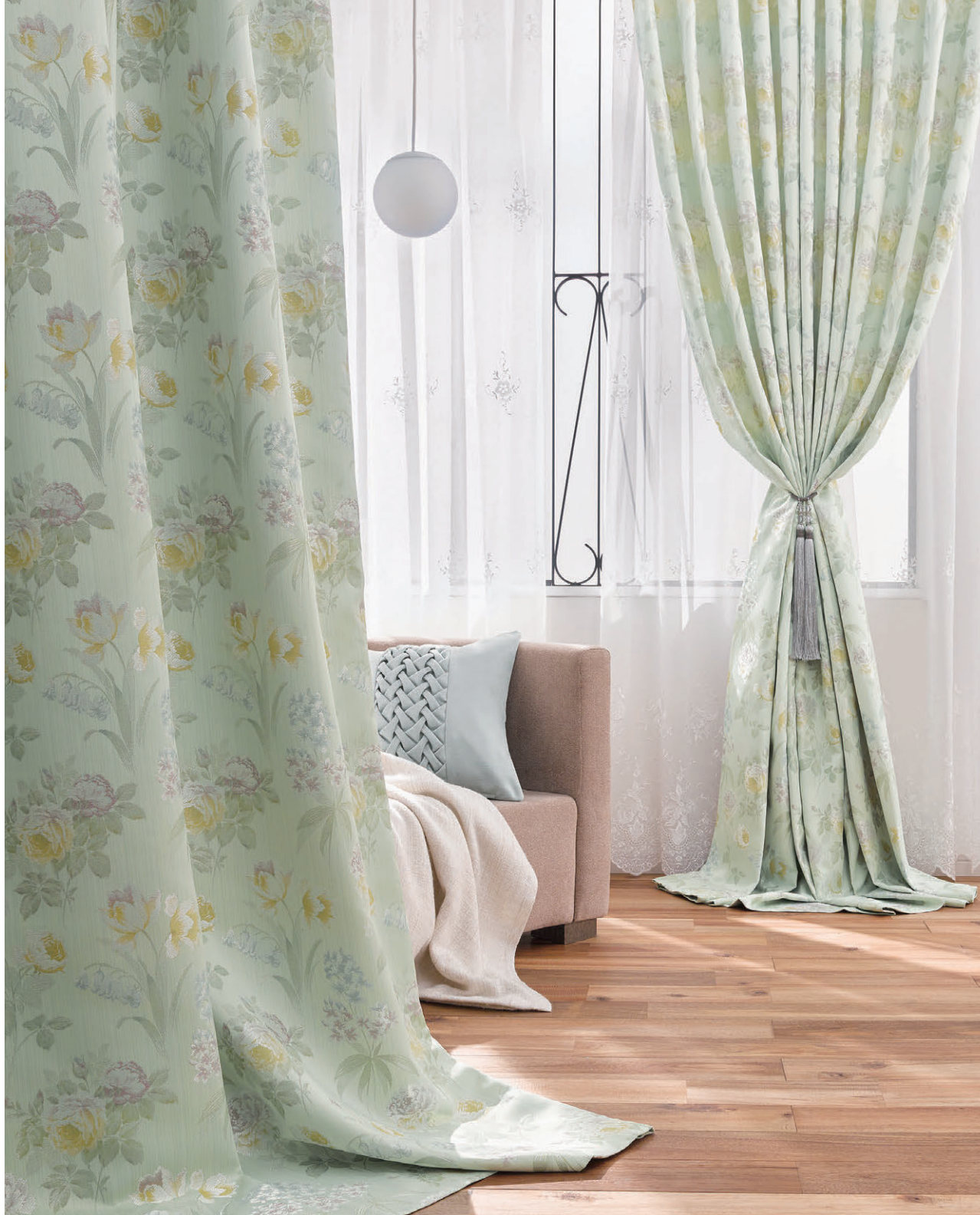
●ドレープ/F1500 ◎シアール/F1508 ◎クッション(グリッドクッションA)/C1054 ◎タッセル/AR3058-91