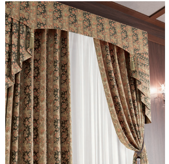
●ドレープ/F1479 ◎シアー/C1349L ◎タッセル/AR3048-09