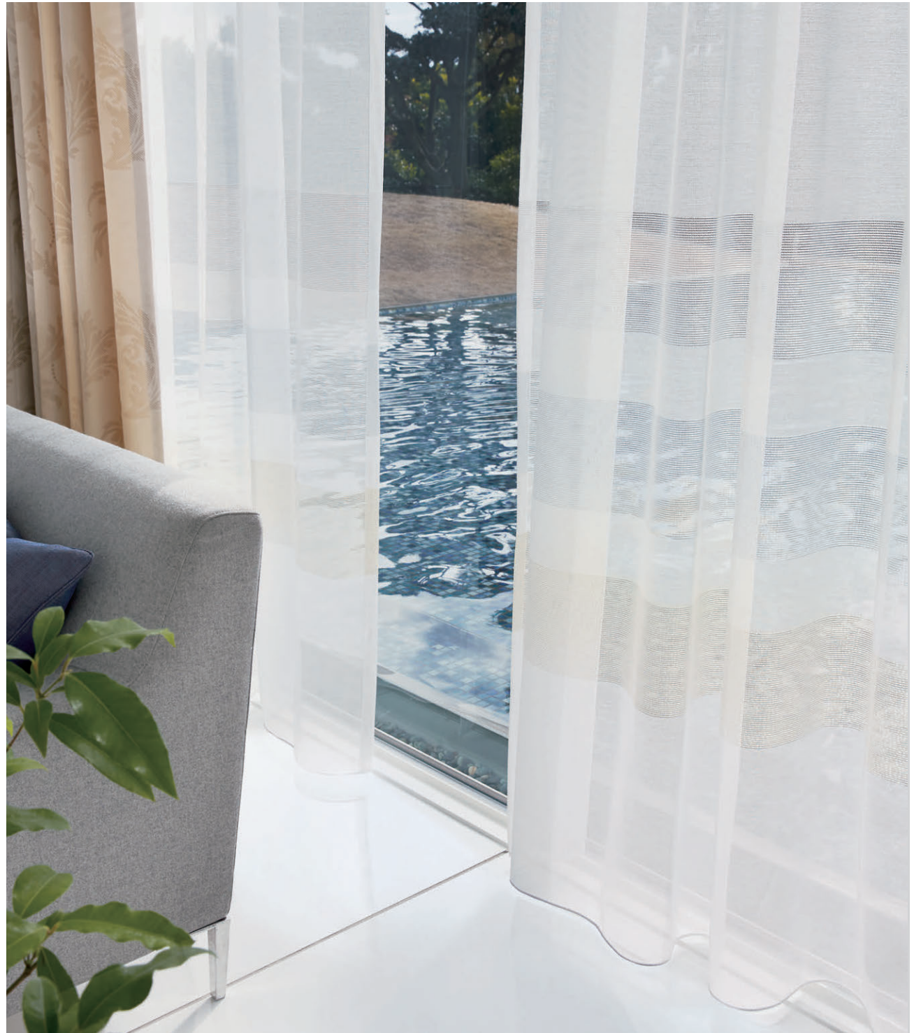
◎シアア(ウェイトテープ縫製)/C1375