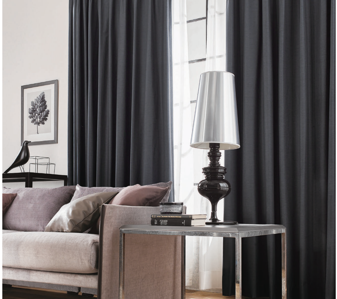
●ドレープ/C1312 ◎シアー/C1417 ◎クッション(パイピング)右側/C1231

SS かぶせ縫い:カーテンの中継ぎの際、継ぎ部を重ねることで継ぎめから光モレを防ぐ縫製。