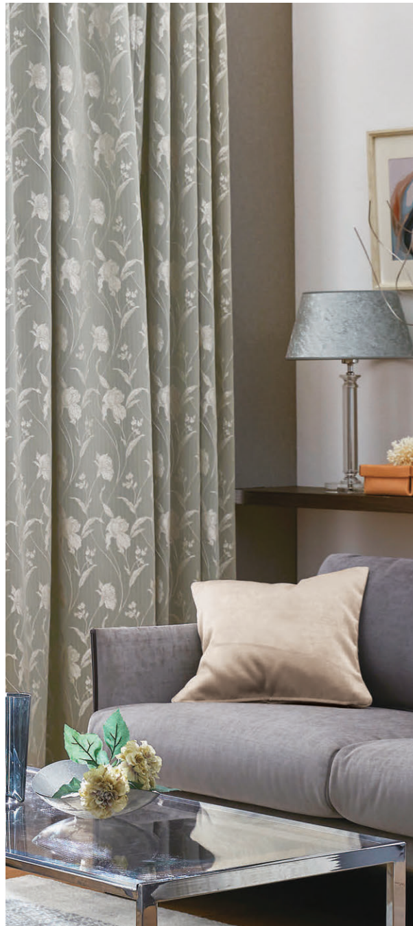
●ドレープ/C1260 ◎シアア/C1386 ●ドレープ/C1261 ◎シアア/C1454 ◎クッション(パイピング)/C1219