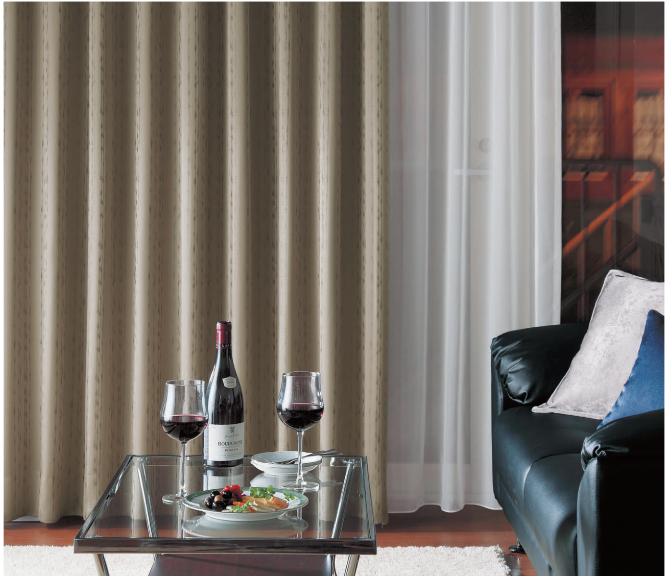
●ドレープ/C1248 ◎シアアー/C1349L

仕上り巾137~147cmで両開きする場合、3ツ山対応不可となり2ツ山になります。 (P.287参照) 仕上り巾300cmを超える場合は、両開きのみになります。