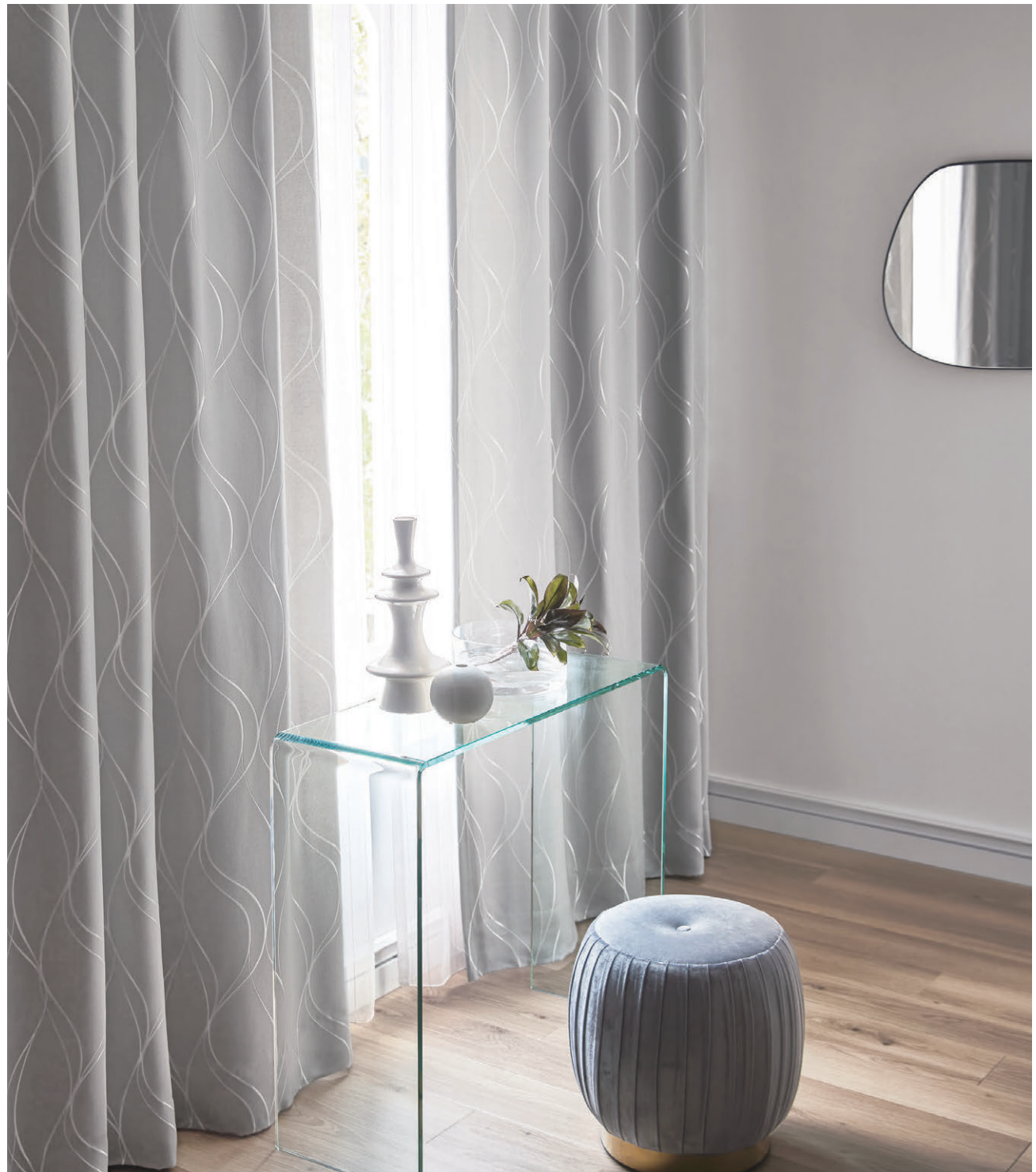
●ドレープ(フラット縫製)/C1235 ◎シアード/C1331