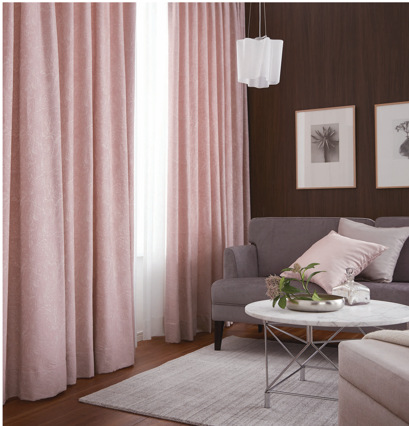
●ドレープ/C1151 ◎シアー/C1419 ◎クッション(パイピング)右から/C1224、C1223