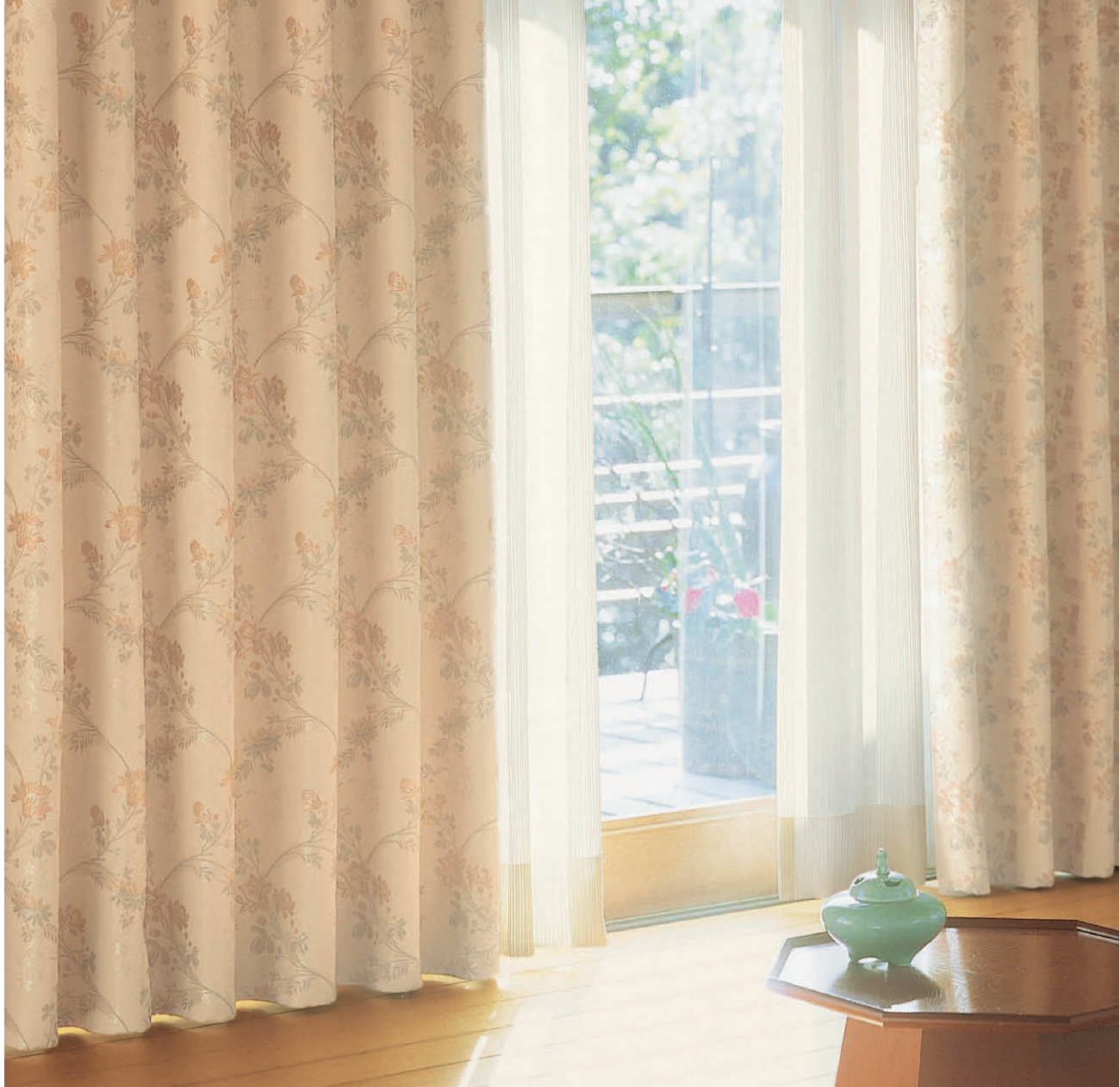
●ドレープ/C1139 ◎シアード/C1449