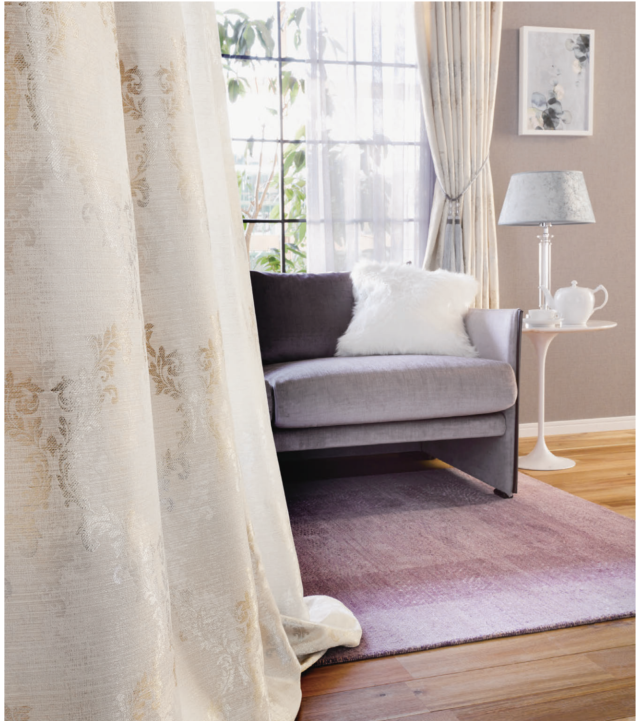
●ドレープ/C1091 ◎シアー/C1388 ◎タッセル/AR3058-91