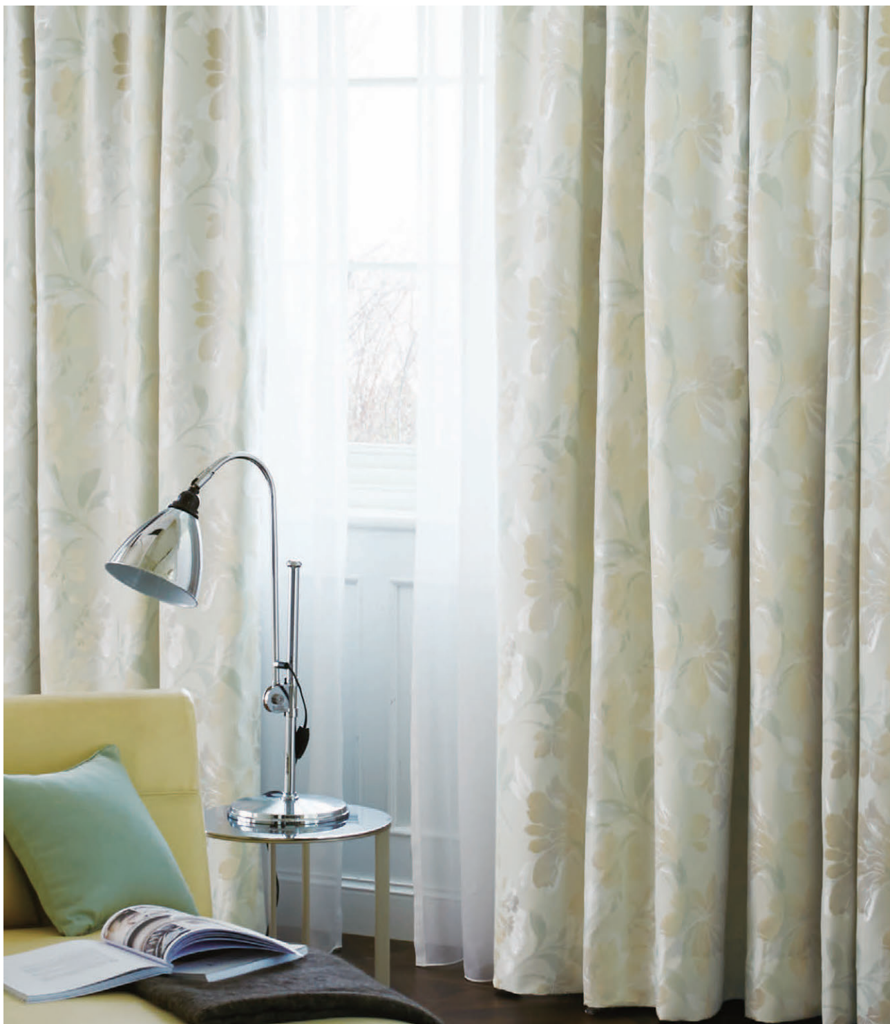
●ドレープ/C1082 ◎シアード/C1346 ◎クッション(ハイピング)/C1054