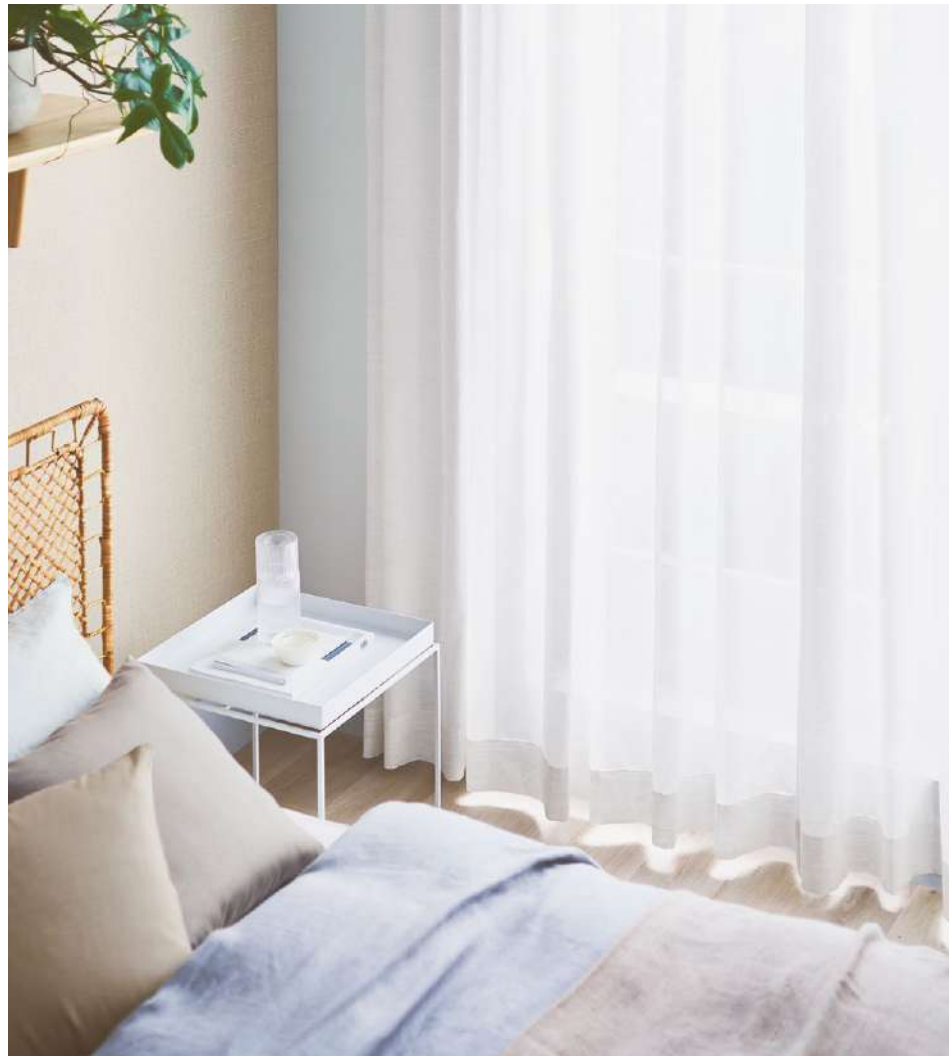
シアー：AC2626 クッション：AC2305、AC2301(P.138) 壁紙：RE53161(2022-2024 RéSERVE)