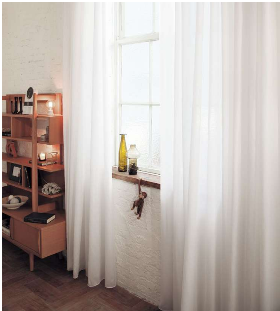
シアー：AC2627 裾ウーリー

※生地特性上、糸の節が目立つことがあります。 ※生地性能維持のため、定期的な洗濯をおすすめします。