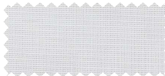
◆ AC2614 見えにくさ C B A A+ 耐光7級以上