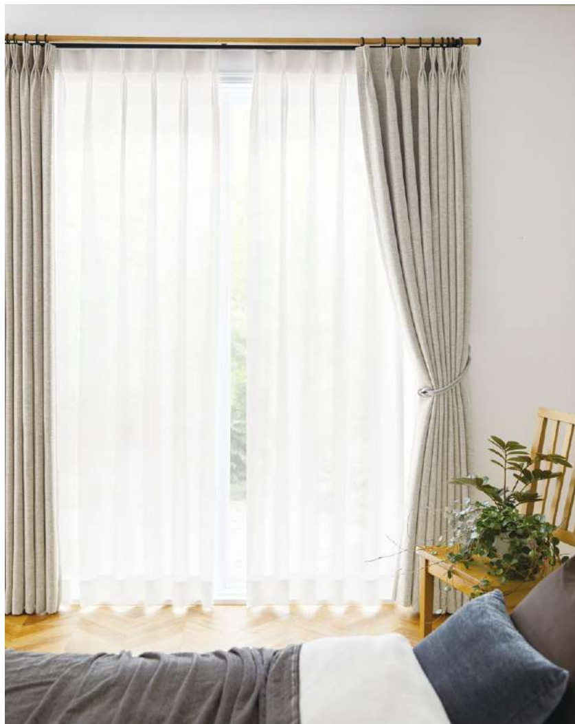
シアー：AC2614 ドレープ LP：AC2446(P.179) タッセル：FN1095