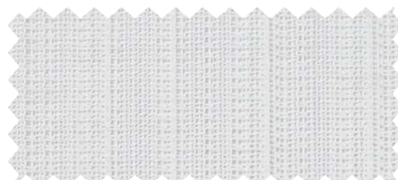
AC2612 見えにくさ C B A A+ 耐光7級以上