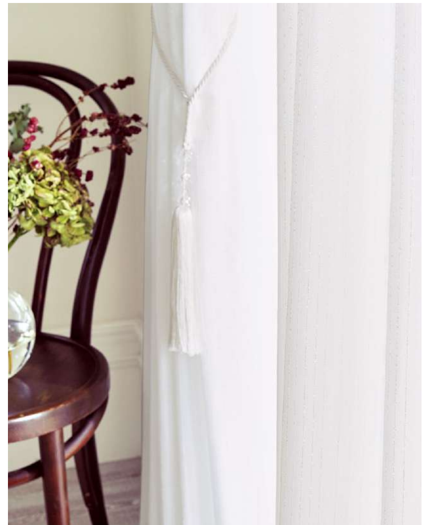
シアー: AC2611 タッセル: FN1005