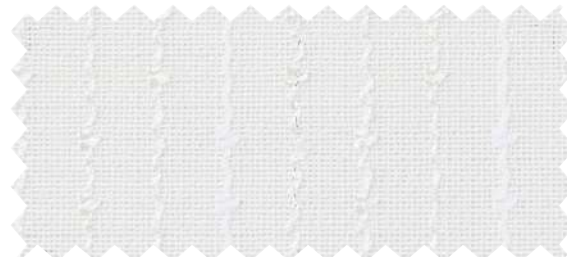
AC2611 見えにくさ C B A A+ 耐光7級以上