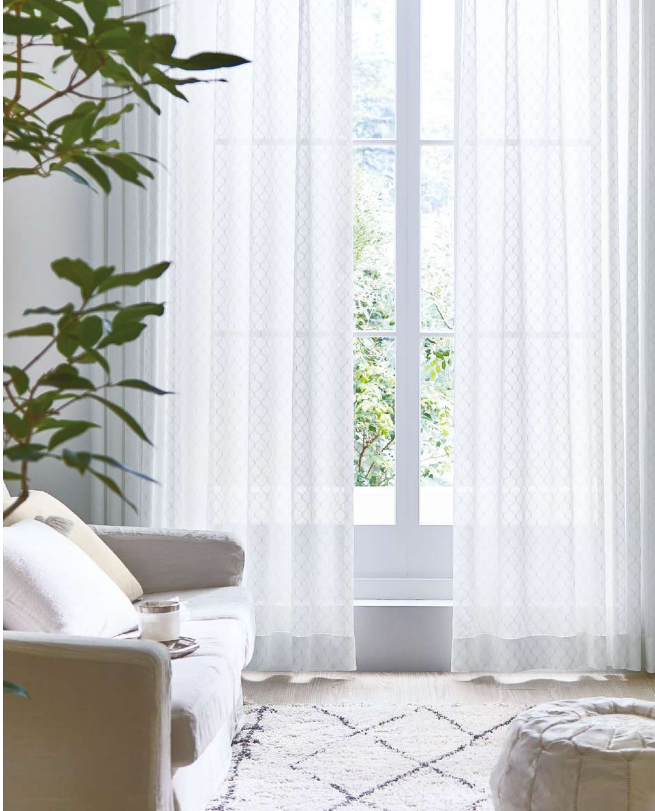
シアー：AC2599 クッション：AC2312(P.140)