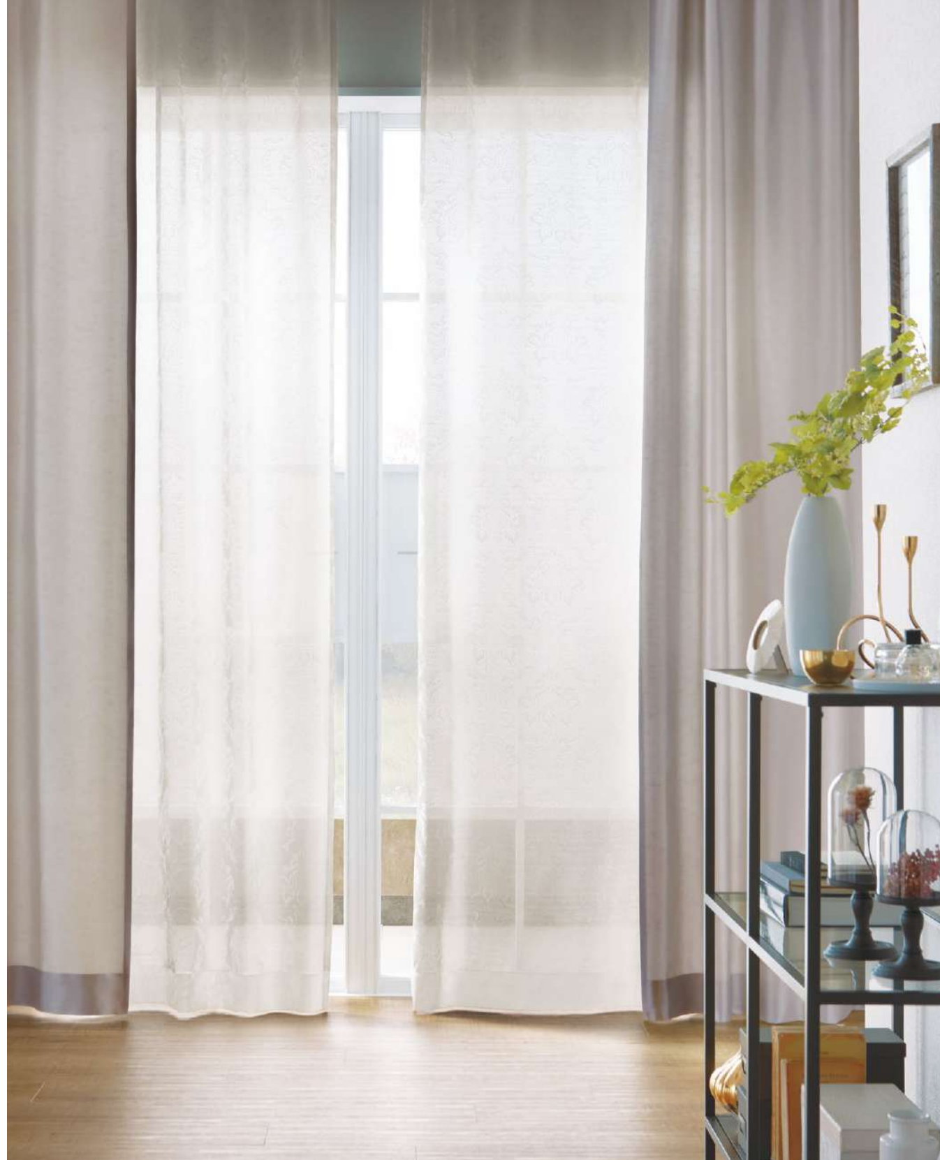
フラットカーテン(1.5倍) : AC2598、AC2345 A面(P.146)