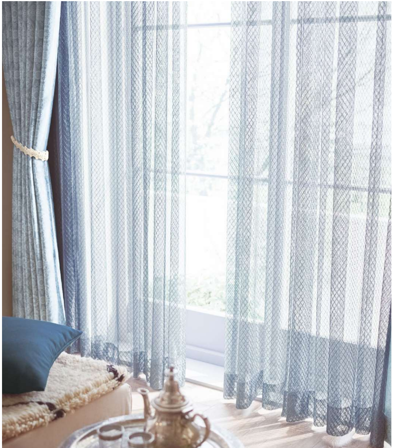
シアー：AC2546 ドレープ : AC2232(P.112) タッセル：FN1111 クッション：AC2325(P.142)