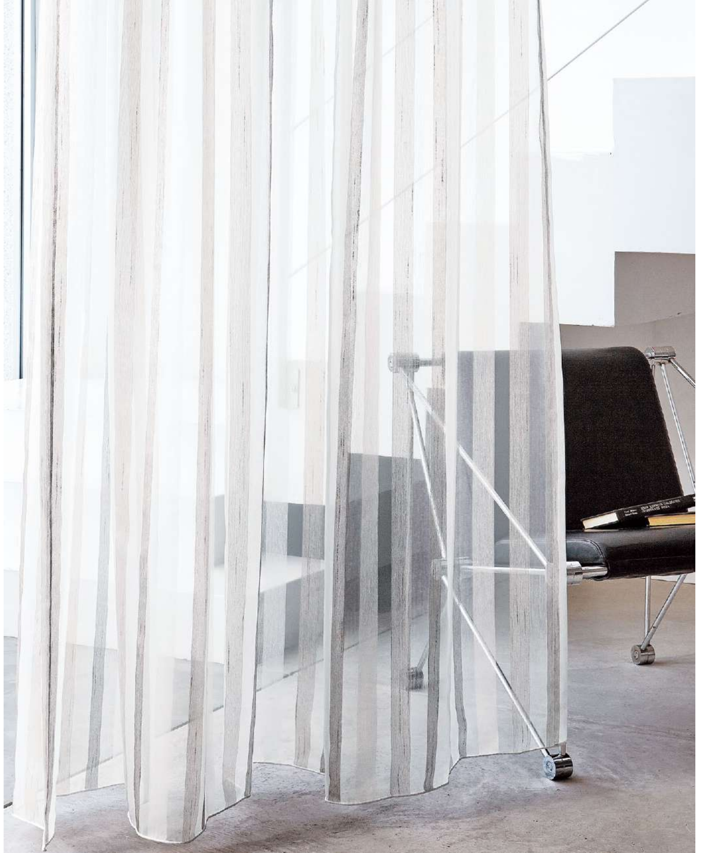
フラットカーテン(1.5倍) : AC2538 裾ウーリー

標準価格 2,420円/m 2 [7,250円/m] 有効巾 300cm (ヨコ使い)