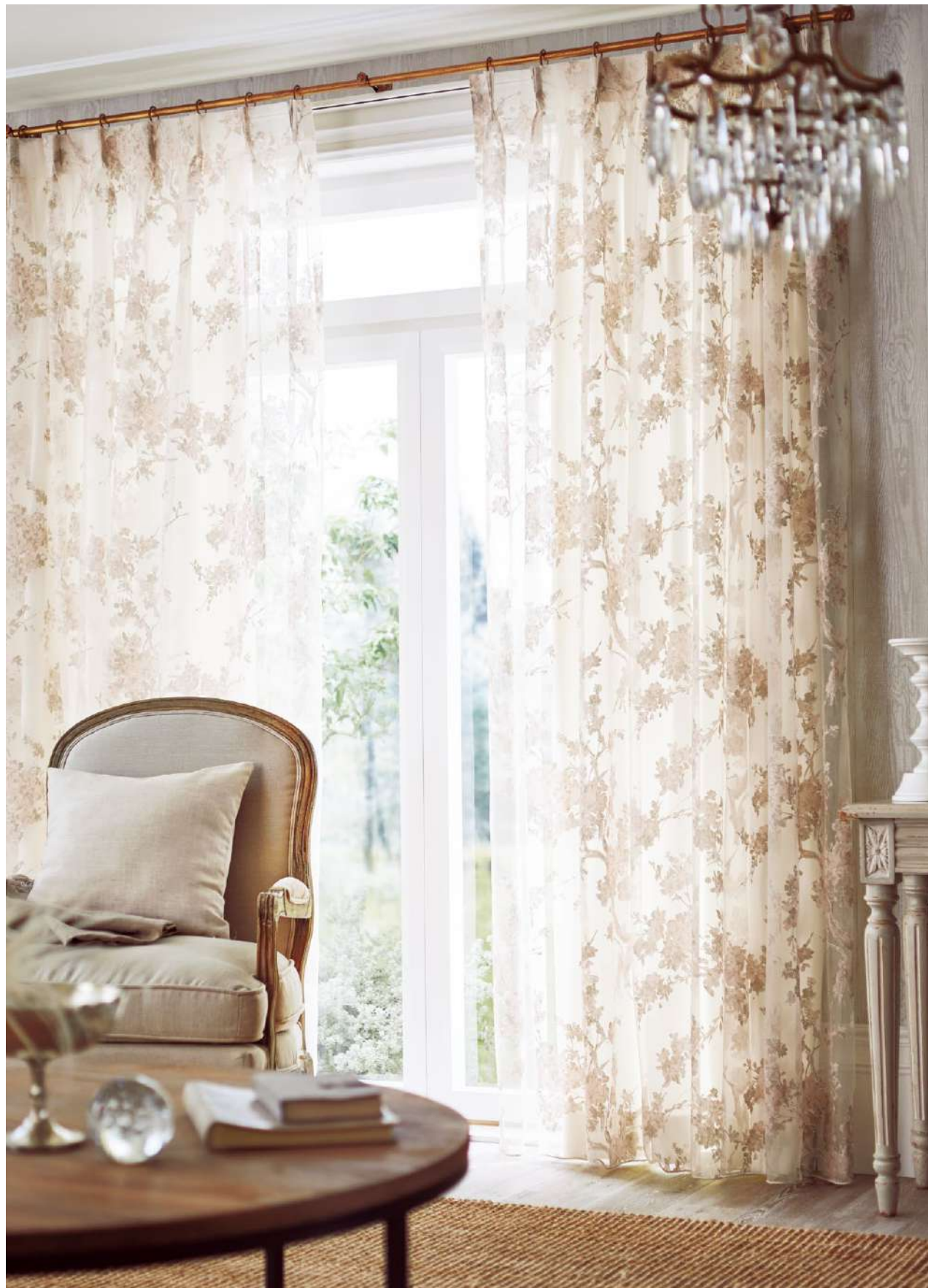
シアー: AC2504 裾ウーリー ドレープ : AC2318(P.142) クッション: AC2025(P.19) 壁紙: FE74201(2021-2023 FINE)

※使用環境により紫外線などの影響で劣化が早く進むことがあります。 ※特殊加工によってラメを施しており、使用環境によってラメが取れる場合があります。 ※生地の製法上、若干の湾曲が生じる場合があります。 ※糸が滑りやすい組織のため、目寄せが起きやすいのでお取り扱いにご注意ください。