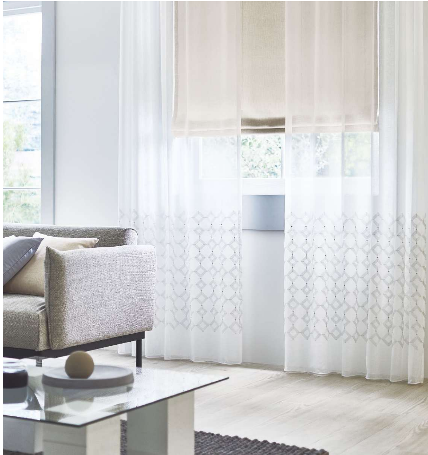
フラットカーテン(1.5倍) : AC2493 裾ウーリー プレーンシェード : AC2271(P.130) クッション : AC2309(P.139)、AC2025(P.19)