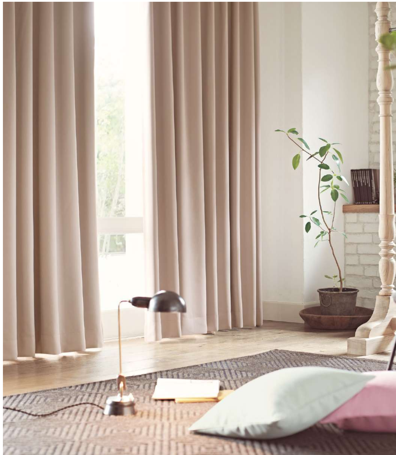
ドレープ LP: AC2460 クッション: AC2453、AC2457