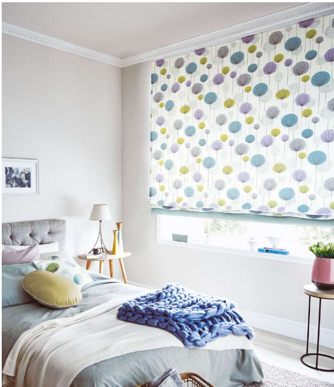
プレーンシェード(ボーダー付 ボトム型)：AC2390・AC2463(P.181 QR参照) クッション：AC2463、AC2461(P.181)、AC2390 パイピングクッション(丸型)：AC2307・AC2300(P.138)