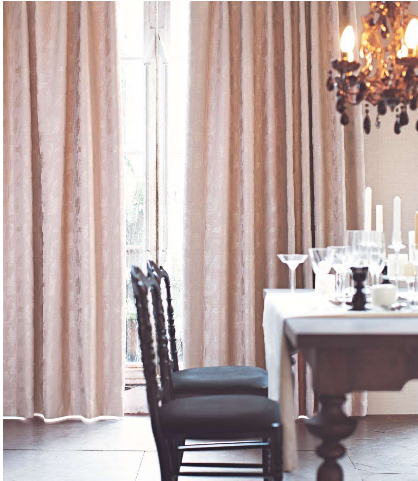
ドレープ LP : AC2379