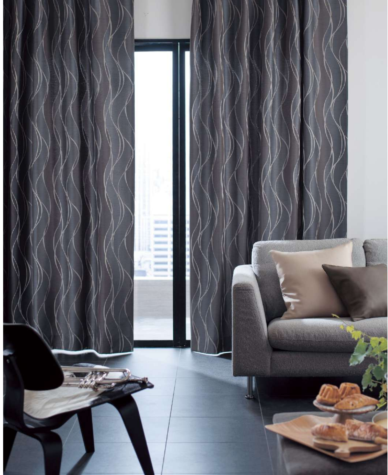
フラットカーテン(1.5倍) : AC2370 クッション : AC2417, AC2419 (P.174)