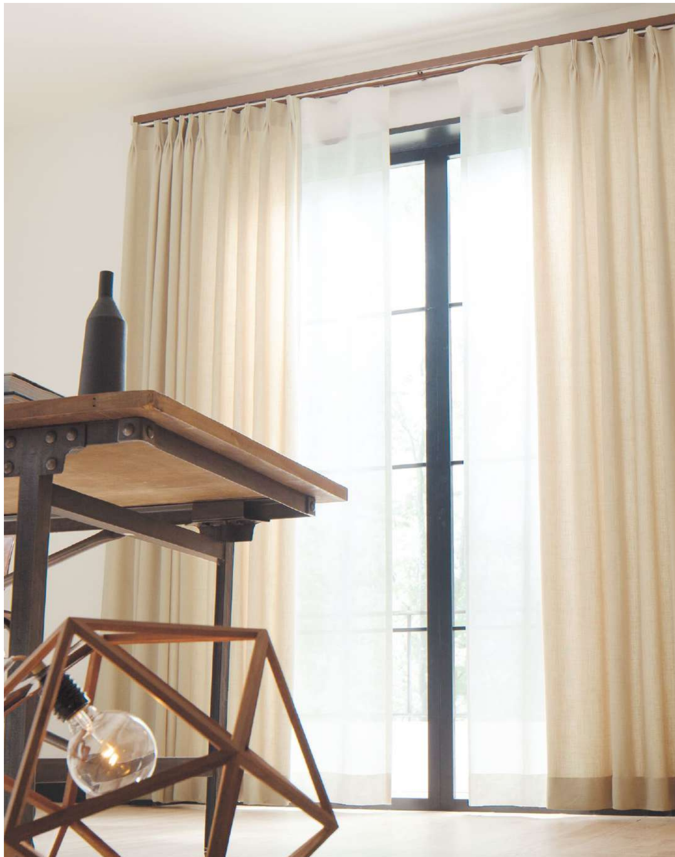
ドレープ : AC2293 フラットカーテン(1.5倍) : AC2564(P.237)