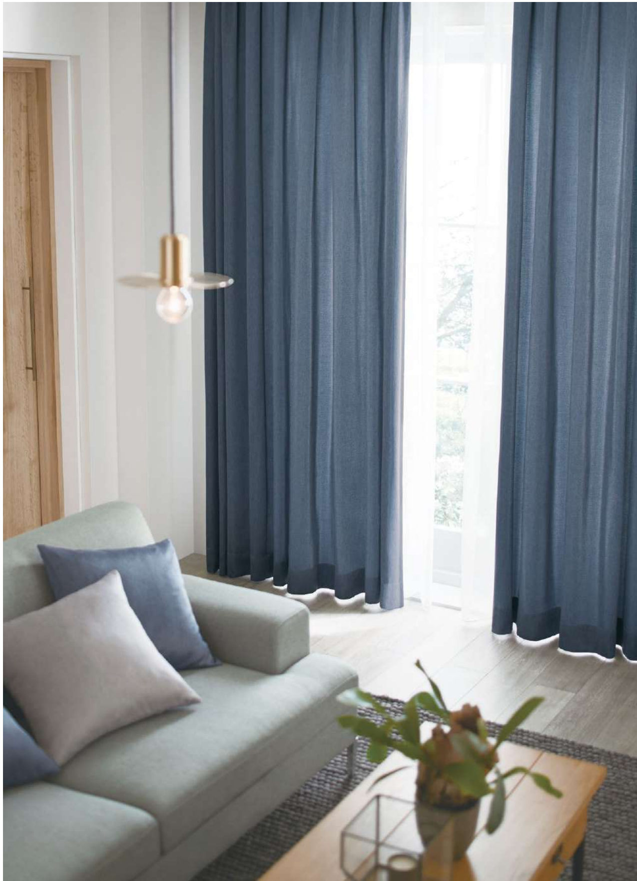
ドレープ : AC2288 シアー : AC2580 裾ウーリー (P.245) クッション : AC2287, AC2288