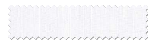
マッチシアー: AC2580 (P.245)